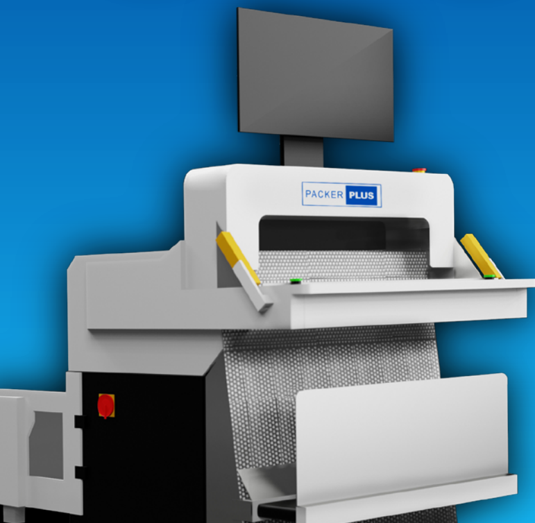
Temps de retour sur investissement: